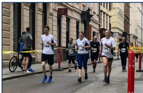
Spodbujamo zaposlene, da so športno aktivni.