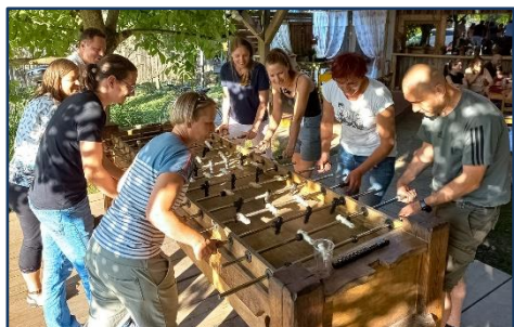
Vsako leto se zaposleni zberemo na pikniku.

Zaposlene spodbujamo, da sodelujejo, se povezujejo, se spoznavajo, družijo. Vsako leto organiziramo piknik za vse zaposlene. Športno aktivne zaposlene pa povezuje slogan ZAGreti, ki krasi majice, izdelane za naše športne navdušence.